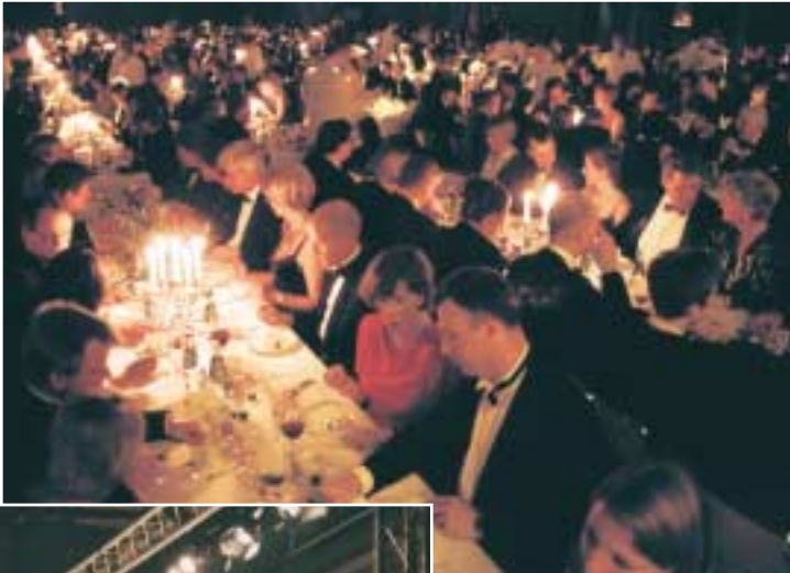
Näringslivet Guldnatten avslutas årligen med en bankett i denna lokal.