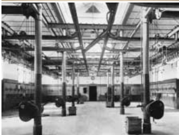
Slakthall för storboskap 1927